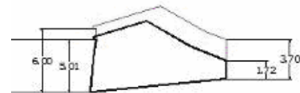
C/ Huertas(en negrita el perfil existente)